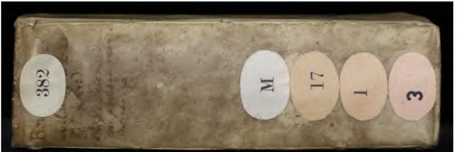
Early European Books, Copyright © 2011 ProQuest LLC. Images reproduced by courtesy of Koninklijke Bibliotheek, Den Haag. 382 M 17 [1]